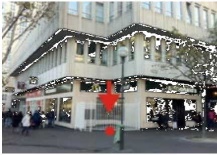
MEETING POINT PHOTO IN PARIS