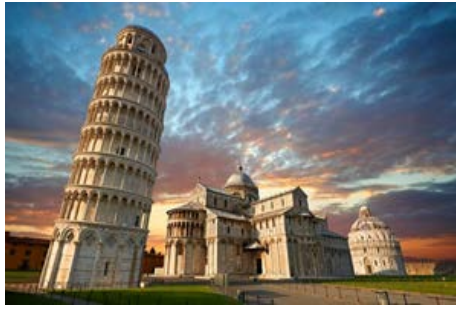
THE LEANING TOWER PISA ITALY