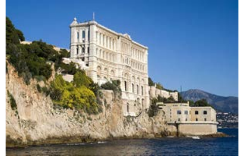
THE CLIFFSIDE OCEANOGRAPHIC MUSEUM MONACO