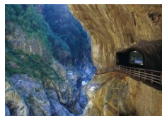
TUNNEL OF NINE