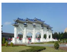
CKS MEMORIAL HALL