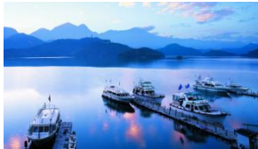
SUN MOON LAKE