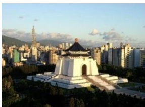
CKS Memorial Hall