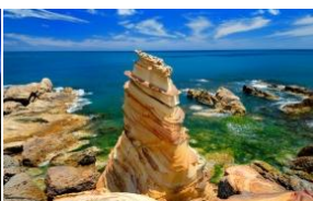
Nanya Rock Formation