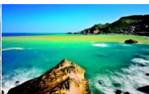
Bay of Two Colors