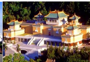
National Palace Museum