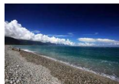
CI HSING BEACH