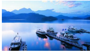
SUN MOON LAKE