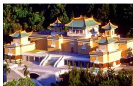
NATIONAL PALACE MUSEUM