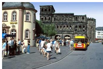
Porta Nigra, Trier