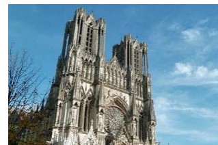
Cathedral of Reims, Paris

Hari ini Anda dapat menikmati waktu bebas Anda di AMSTERDAM hingga penjemputan kembali ke Airport