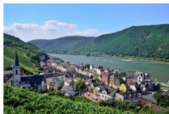
Rhine Valley, Germany