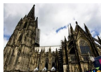
Gothic Cathedral, Cologne