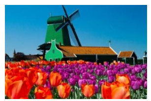
Zaanse Schans, Netherlands