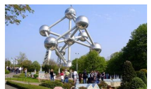
Atomium monument, Bussels