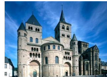
Trier Cathedral, Germany