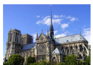
Notre Dame Cathedral, Paris