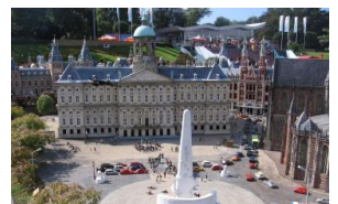
Royal Palace, Dam Square