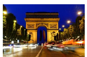
Champs Elysees, Paris