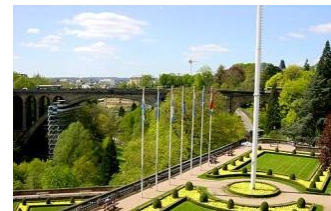
Place de Constitution, Luxembourg