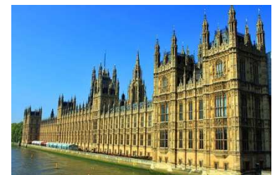
HOUSE OF PARLIAMENT, LONDON

HOLIDAY INN LONDON - BRENTFORD LOCK | IBIS LONDON WEMBLEY | setaraf