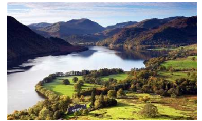
THE LAKE DISTRICT NATIONAL PARK

HOLIDAY INN HARROGATE | BLACKWELL GRANGE HOTEL | setaraf