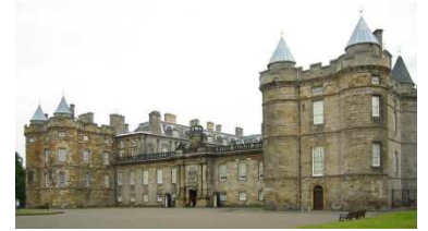
HOLYROOD PALACE, EDINBURGH

HOLIDAY INN LONDON - BRENTFORD LOCK | IBIS LONDON WEMBLEY | setaraf