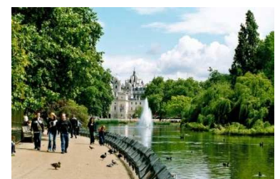
St. JAMES PARK, LONDON