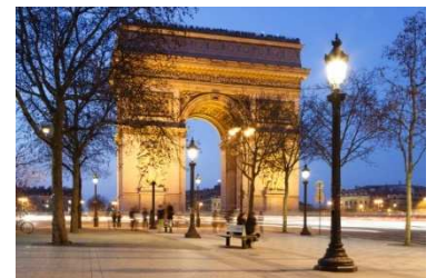
PLAZA MAYOR, MADRID

HOTEL 3* in or outside Barcelona: COMFORT HOTEL AIRPORT CDG | BALLADINS VILLEJUIF | setaraf