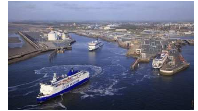
PORT OF CALAIS

HOLIDAY INN LONDON - BRENTFORD LOCK | IBIS LONDON WEMBLEY | setaraf