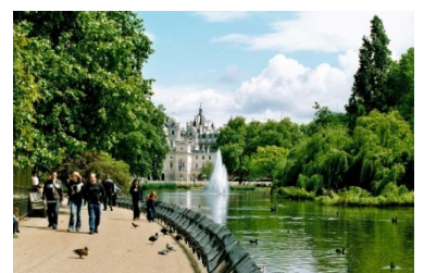
St. JAMES PARK, LONDON