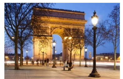
PLAZA MAYOR, MADRID

HOTEL 3* in or outside Barcelona: COMFORT HOTEL AIRPORT CDG | BALLADINS VILLEJUIF | setaraf