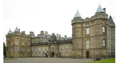
HOLYROOD PALACE, EDINBURGH

HOLIDAY INN LONDON - BRENTFORD LOCK | IBIS LONDON WEMBLEY | setaraf