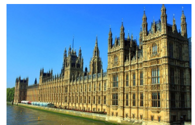
HOUSE OF PARLIAMENT, LONDON

HOLIDAY INN LONDON - BRENTFORD LOCK | IBIS LONDON WEMBLEY | setaraf