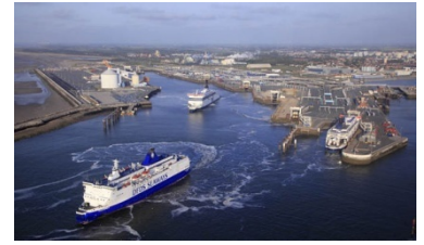
PORT OF CALAIS

HOLIDAY INN LONDON - BRENTFORD LOCK | IBIS LONDON WEMBLEY | setaraf