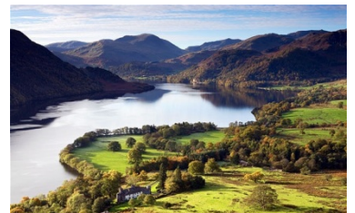
THE LAKE DISTRICT NATIONAL PARK

HOLIDAY INN HARROGATE | BLACKWELL GRANGE HOTEL | setaraf